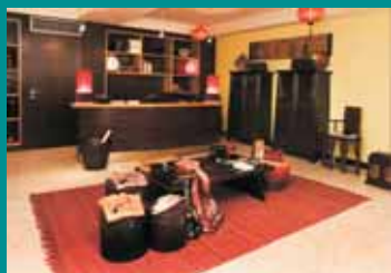
博物館商店 在歐維治基金會的 贊助下，裝修後開張

根據兩個機構間的協議，澳門科學文化中心博物館商店在進行了全面裝修後開業。那裏可以購買到有關澳門的貨物和商品，尤其是博物館展品的複製件，“貿易”物品，關於澳門，中國文化或遠東文化的出版物，還有各種具有東方文明特徵及反映葡中貿易關係史的物品。