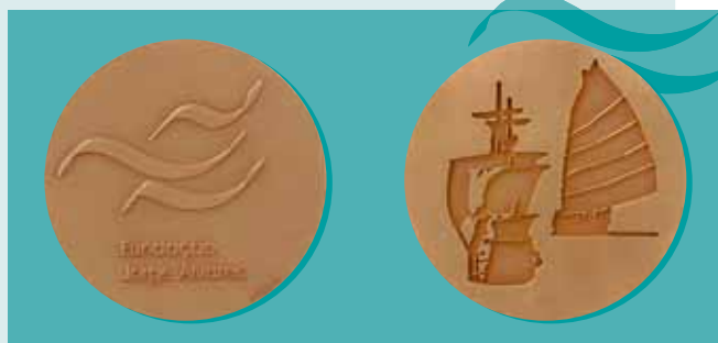
Medalhão da Fundação Jorge Álvares, da autoria de David de Almeida

Constituída por duas medalhas, nas duas frentes – em português e em chinês – o campo da medalha foi trabalhado com o logótipo da FJA, sendo que o cérebro da medalha – os versos das duas frentes – é composto por um junco e por uma nau em alto e baixo relevos de forma que, ao encaixarem, se tornam numa peça só. Recuperando o princípio da autorização de entrada na Cidade Proibida, a peça evoca e sugere o relacionamento singular e o conhecimento e confiança mútuos entre as duas culturas e os dois povos durante mais de quatro séculos.