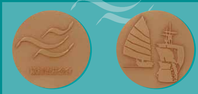
歐維治基金會紀念章，阿爾梅達(David de Almeida)設計

由兩個徽章構成，一面為葡語，另一面為中文。正面上有歐維治基金會的標誌。兩個徽章反面的中央分別為深淺浮雕的一艘中國式帆船和一艘葡萄牙大船，合起來後成為一件。構思基於紫禁城